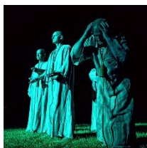
Les Médiévales des Arcs Du 17 au 20 juillet 2015 Les Festes du Castrum d'Arcus